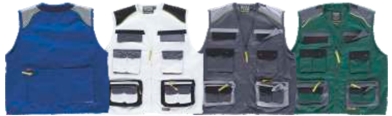
azulina/gris cl./marino blanco/negro/gris osc. gris osc./gris cl./negro verde osc./gris osc./negro