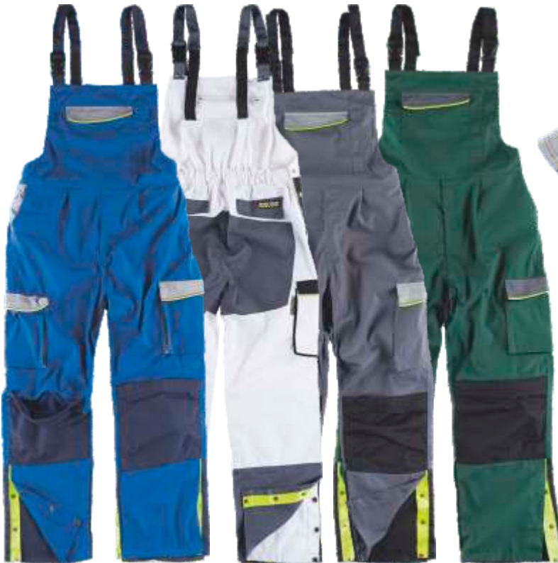
azulina/gris cl.o/marino blanco/negro/gris osc. gris osc./gris cl./negro verde osc./gris osc./negro

Tejido: 65% Poliéster 35% Algodón (230 g/m2)