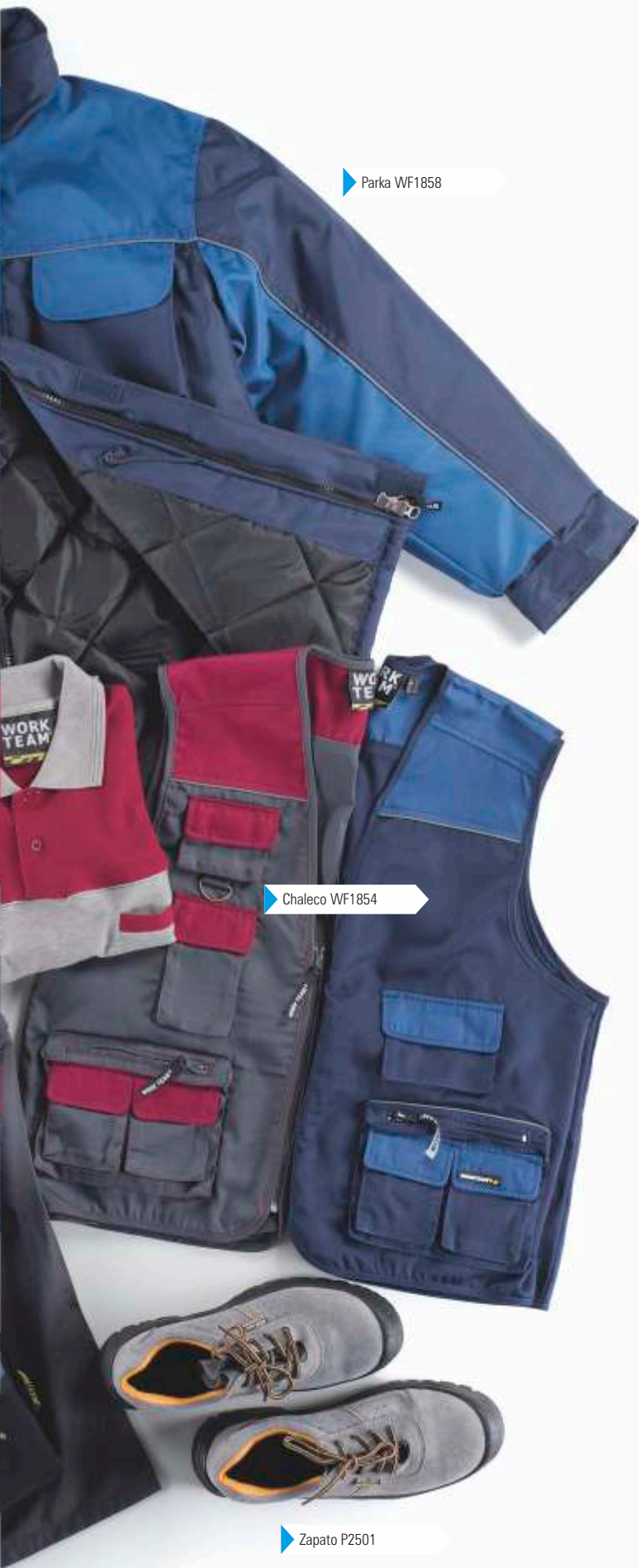
▶ Parka WF1858