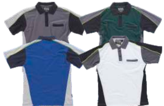
azulina/gris cl.o/marino blanco/negro/gris osc.