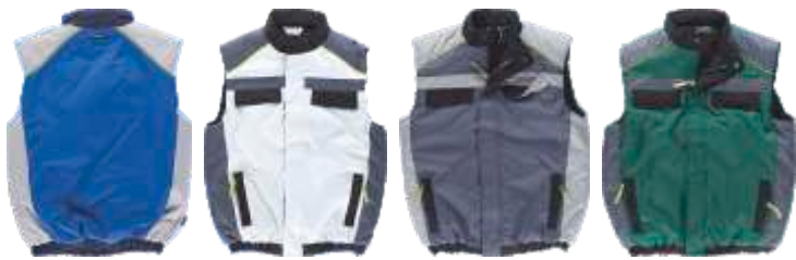
azulina/gris cl./marino blanco/negro/gris osc. gris osc./gris cl./negro verde osc./gris osc./negro